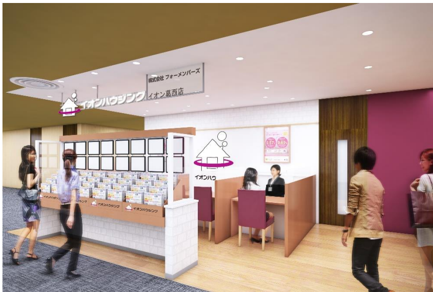
「イオンハウジング イオン葛西店」店舗イメージ

「イオンハウジング イオン葛西店」は、イオンハウジングが展開する17店舗（イオンモール直営店：5店舗、フォーメンバース運営店舗：11店舗、AHN加盟店舗：1店舗）のうち、現在フォーメンバースが運営する店舗であり、2017年12月15日にオープンいたしました。