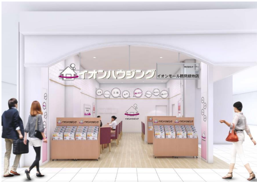
「イオンハウジング イオンモール鶴見緑地店」店舗イメージ

「イオンハウジング イオンモール鶴見緑地店」は、イオンハウジングが展開する20店舗（イオンモール直営店：5店舗、フォーメンバーズ運営店舗：10店舗、AHN加盟店舗：5店舗）を展開する中、21店舗目として出店する大阪エリア2号店であり、AHN加盟店としては6店舗目となります。