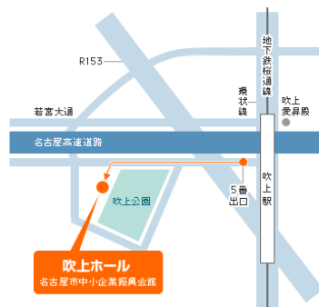
名古屋市中企業復興会館「吹上ホール」 名古屋市中千種区吹上2-6-3