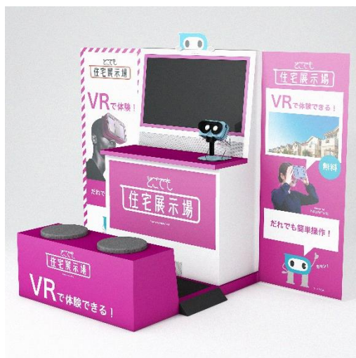
「どこでも住宅展示場™」 筐体イメージ